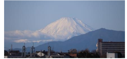
白楽の高台付近から望む元日の富士山

備えあれば患い無し！4年ぶりに防災フェアーを開催し、地震災害発生時の災害対策本部立ち上げ、安全確認、炊き出し訓練等を検証します。