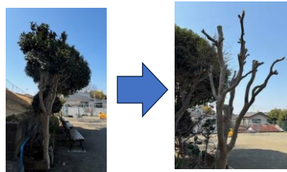
茶毒蛾対策で剪定しました